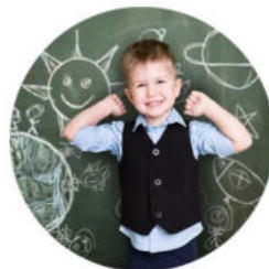
przedszkola / dyżury wakacyjne