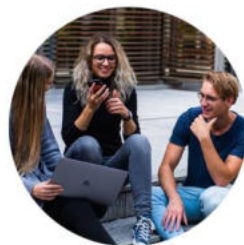
szkoły branżowe II stopnia